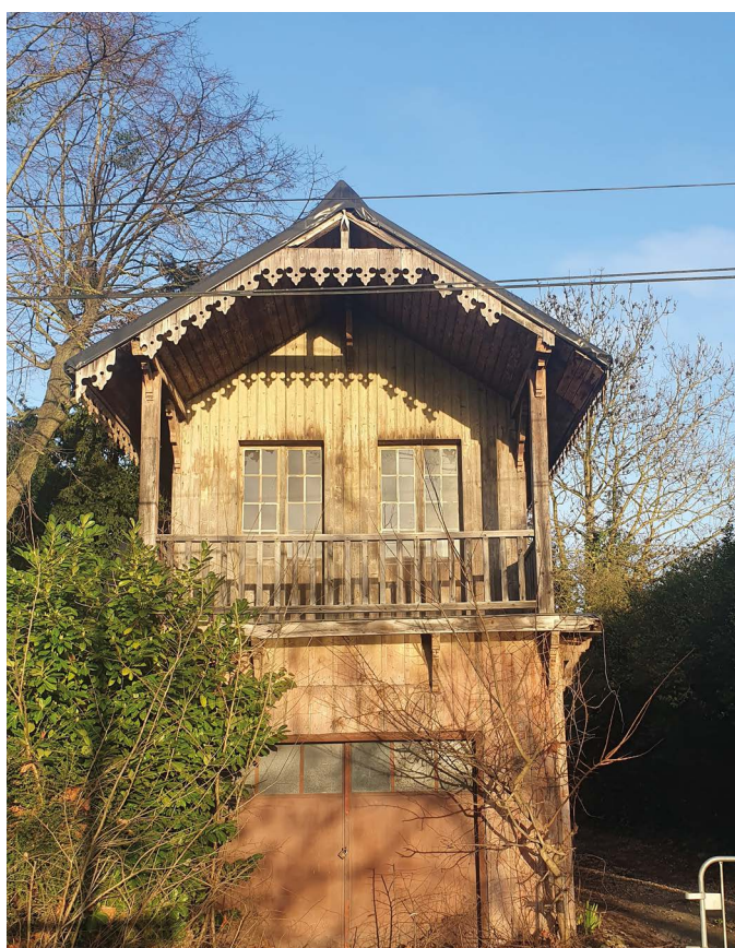
Hangar à bateaux

Hangar à bateaux de Pontoise, Val d'Oise (95) : dotation de 100 000 €