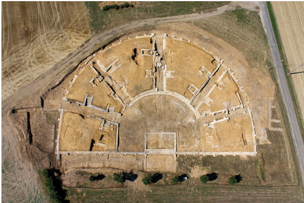
Site archéologique gallo-romain de Châteaubleau

Pour rappel : le projet emblématique 2023 pour la région Île-de-France est le site archéologique gallo-romain de Châteaubleau , Seine-et-Marne (77), qui a été doté de 200 000 €.