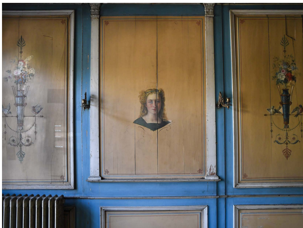
Boudoir de la Maison Masséna à Bagneux

Boudoir de la Maison Masséna à Bagneux, Hauts-de-Seine (92) : dotation de 65 000 €