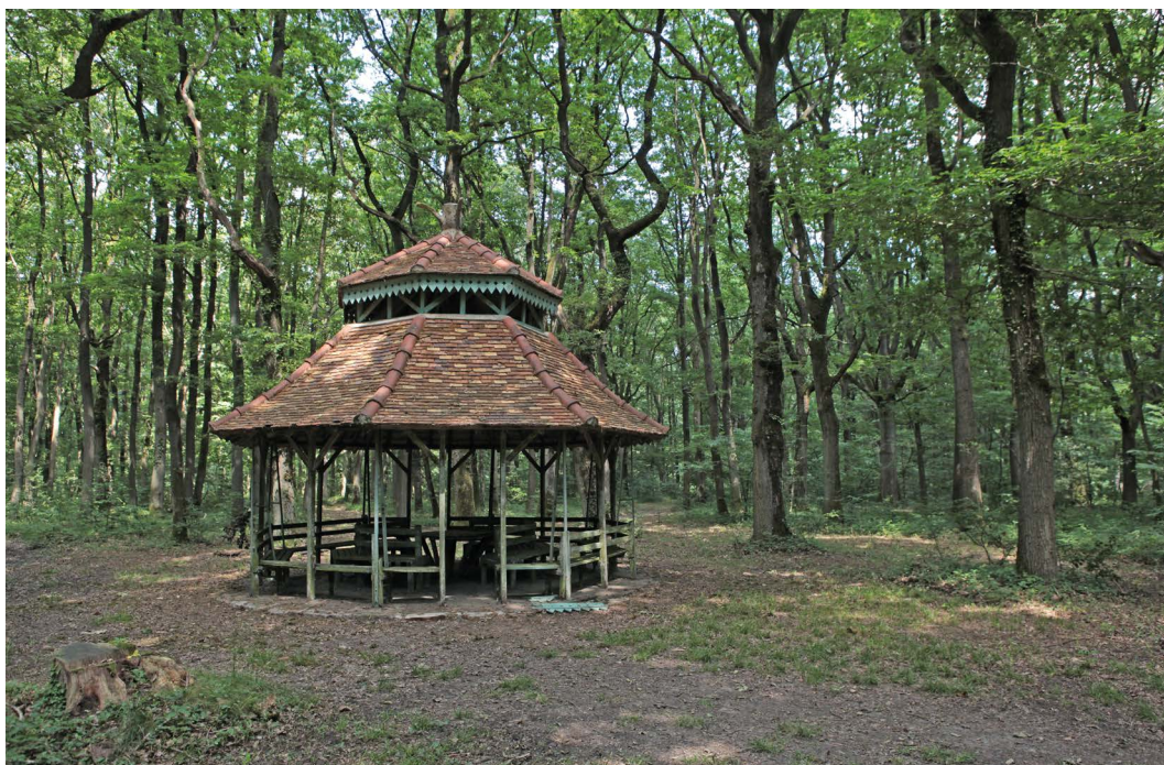
Kiosques du Parc du Centre Hospitalier de Bligny

Kiosques du Parc du centre hospitalier de Bligny à Briis-sous-Forges, Essonne (91) : dotation de 75 000 €. Le projet recevra une dotation complémentaire de 100 000 € grâce au mécénat d'AXA France pour contribuer au financement des travaux de restauration. Il fait partie des 6 sites retenus après un vote des collaborateurs d'AXA France, de ses partenaires et du grand public.