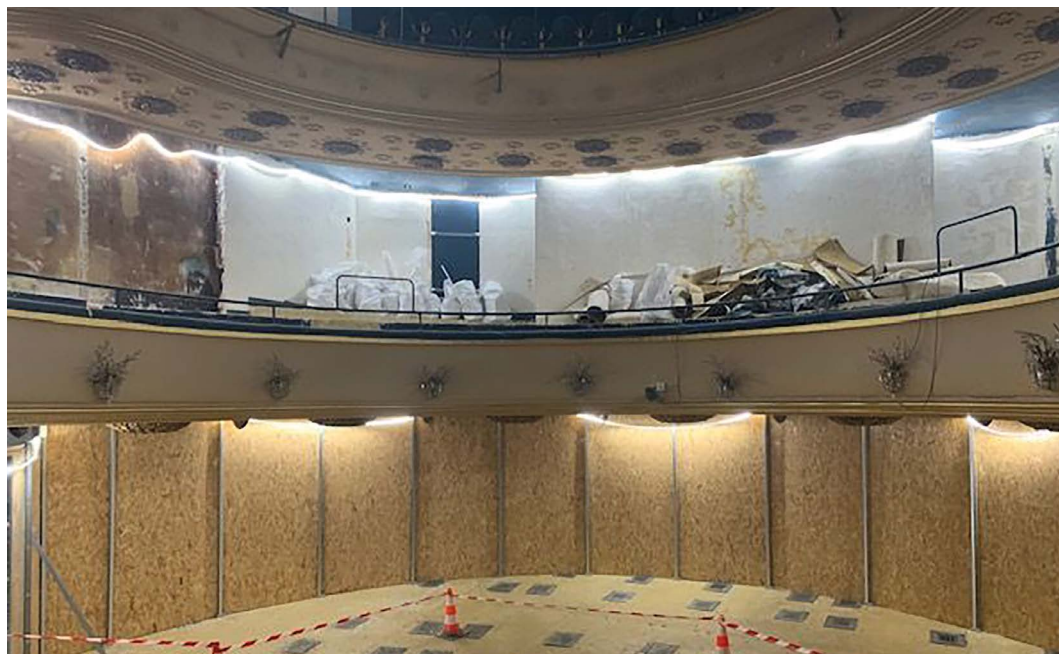
Décors intérieurs du Théâtre Daunou

Décors intérieurs du Théâtre Daunou à Paris (75) : dotation de 100 000 €