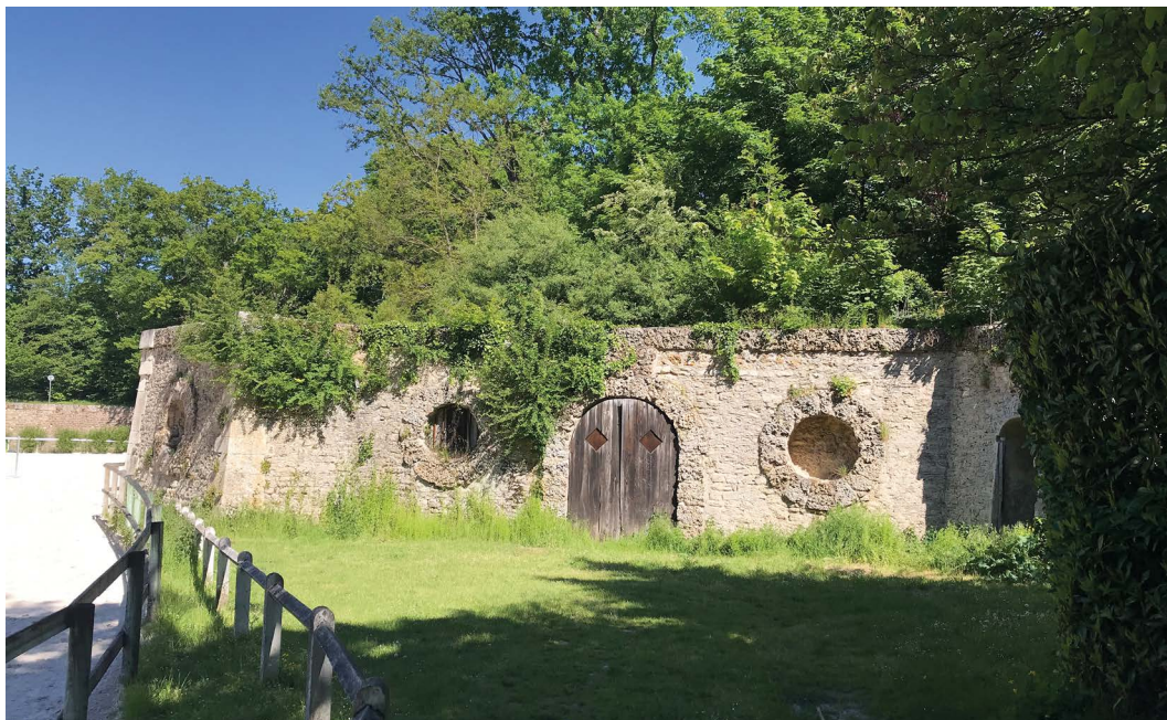
Caves du Nord du Parc du château de Maisons-Laffitte

Caves du Nord du parc du château de Maisons-Laffitte, Yvelines (78) : dotation de 220 000 €