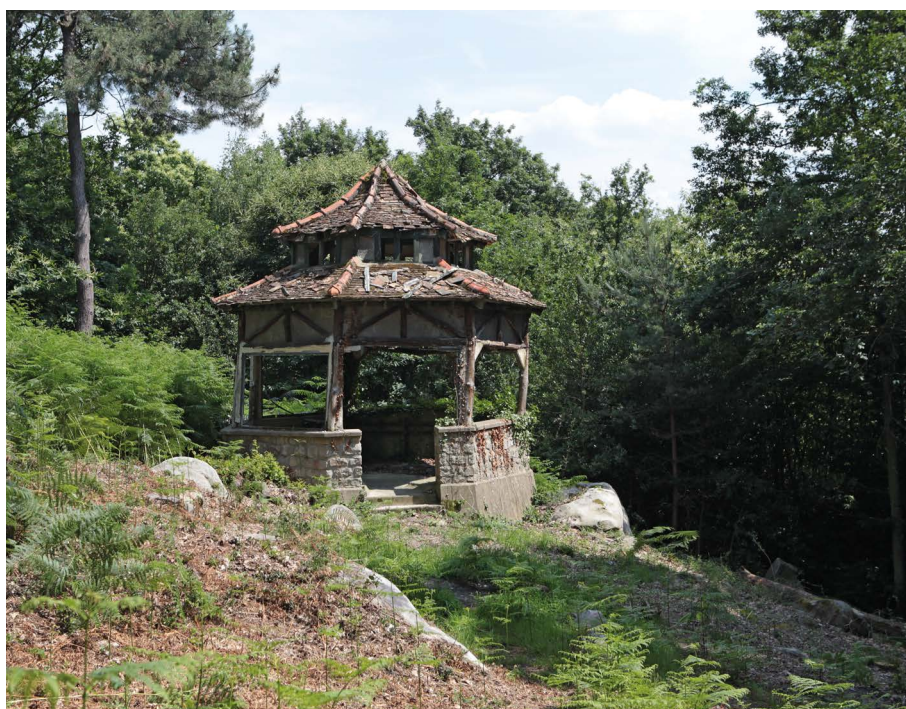
Kiosques du Centre Hospitalier de Bligny

La Mission Patrimoine pour la sauvegarde du patrimoine en péril portée par Stéphane Bern, déployée par la Fondation du patrimoine et soutenue par le ministère de la Culture et FDJ, est heureuse de dévoiler le montant des aides accordées aux 8 sites départementaux de la région Île-de-France sélectionnés en 2023 (100 projets au total en France métropolitaine et collectivités d'outre-mer).