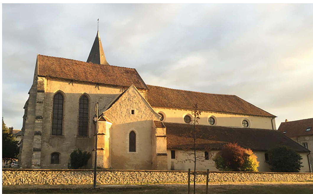
Eglise Saint-Rémi de Montévrain

Eglise Saint-Rémi de Montévrain, Seine-et-Marne (77) : dotation de 300 000 €