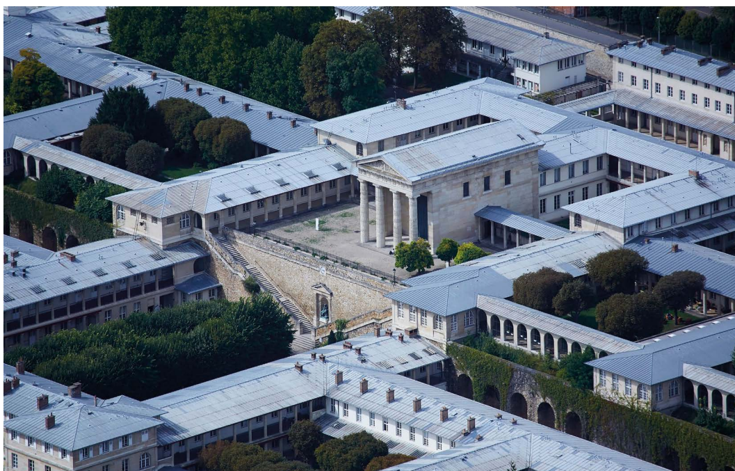
Chapelle des Hôpitaux de Saint-Maurice

Chapelle des Hôpitaux de Saint-Maurice, Val-de-Marne (94) : dotation de 300 000 €